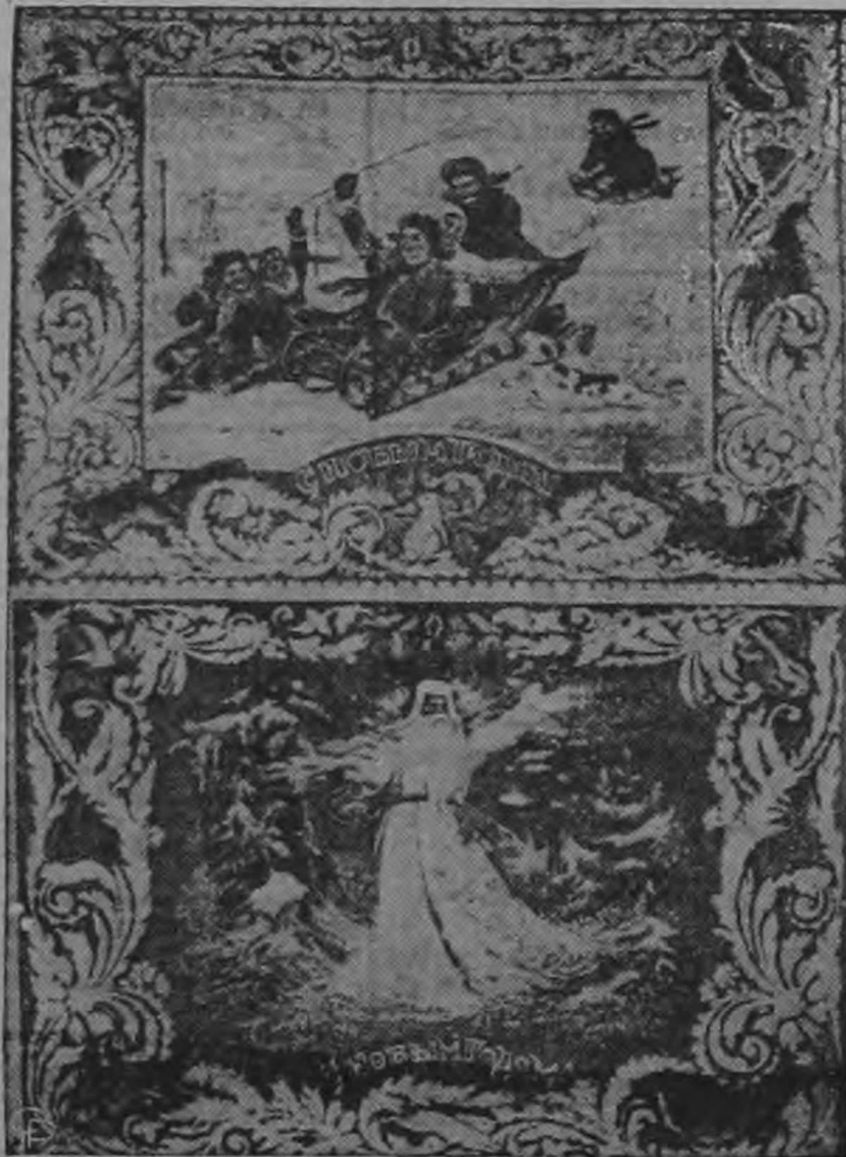
En la gráfica se admiran dos estilos de tarjetas de felicitación rusas. En cada una de ellas se puede leer la frase rusa 'S Movim Godum' que traducida la español quiere decir Feliz Año Nuevo.

EL DAÑO DEL ALCOHOL LO HEREDAN LOS HIJOS, LOS NIETOS LOS BISNIETOS, LA DESCENDENCIA TODA.