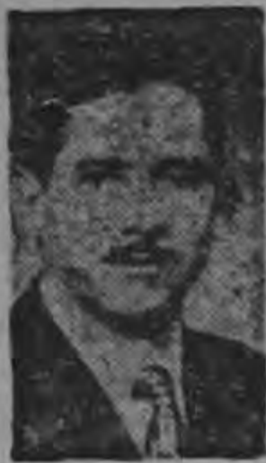
Diputado Castillo Rojas

Al iniciarse la sesión legislativa de ayer, en el capítulo de proposiciones el diputado Castillo Rojas presentó una moción tendiente a favorecer a los trabajadores cesantes por suspensión de los trabajos de la Interamericana. Se trata de excitativa al Ejecutivo para proporcionar ayuda económica a esos trabajadores cesantes por suspensión de los trabajos de la carretera. La proposición resultó aprobada por la Asamblea, por lo cual se espera que en breve sea solucionada la seria situación por la cual atraviesan actualmente esas personas.