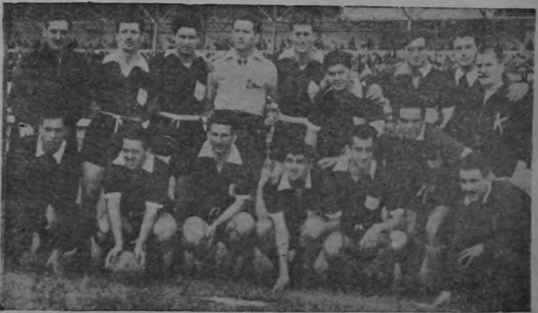
El equipo de Lanús despejando cualquier duda que existiera sobre su verdadera potencialidad, hizo trizas al equipo Herediano, que se vió arrollado por un equipo perfecto en todas líneas. En esta su segunda presentación logró Lanús borrar la impresión del debut, en el que apenas asomó una parte mínima de toda su grandeza futbolística. El domingo si pudimos admirar al Lanús que clasificó quinto en el campeonato argentino y que terminó invicto su temporada en el Perú.