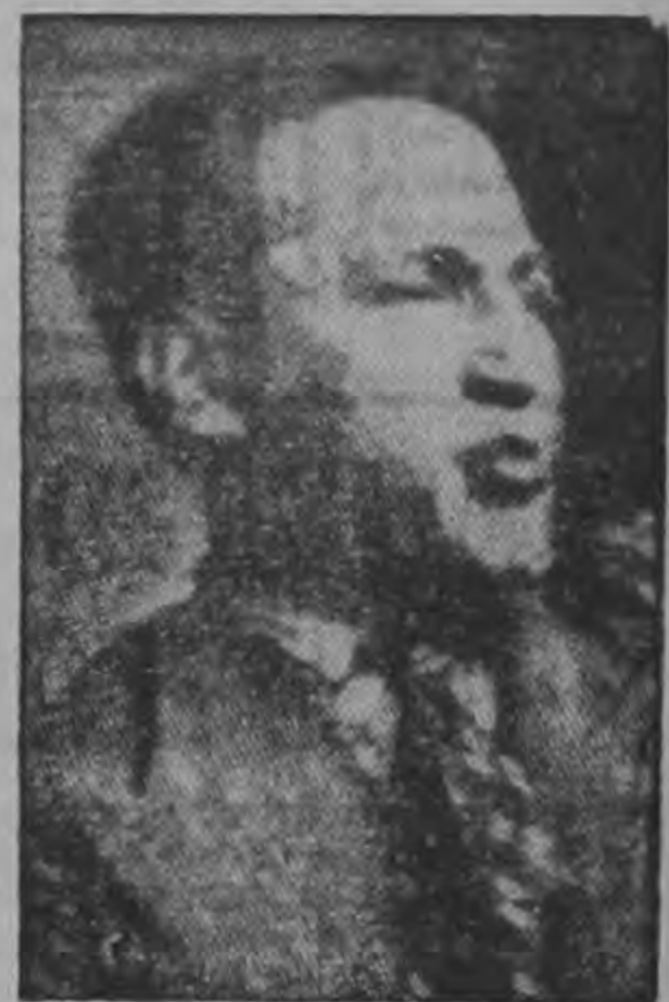
Victor Raúl Haya de la Torre, político peruano.