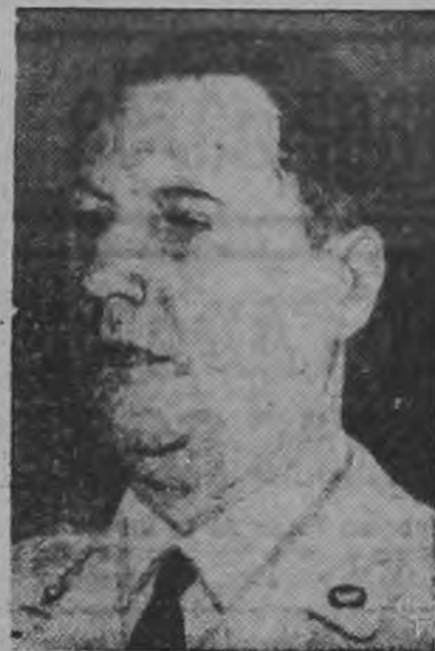
Juan Domingo Perón, que hace unas cuantas semanas fue derrocado del Gobierno de la República Argentina.

El camino hacia la seguridad habitualmente es la distancia mas corta que existe entre la casa del Presidente y el edificio de la más cercana Embajada extranjera.