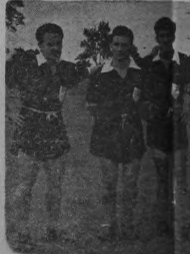
La delantera de Lanús demostró todo su talento en seis oportunidades el arco florense fueron perfectos y la habilidad en el manejo de los hombres resultaron un problema indesmentable. Cejas marcó cuatro goles, Fernández y Goñi media docena.