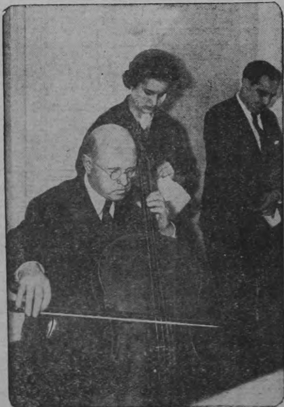
Pablo Casals, famoso violoncelista que se había retirado por muchos años vuelve a ejecutar en forma maravillosa su instrumento en un concierto dedicado a la memoria de su señora madre, en la casa en que la autora de sus días nació, en Mayagüez, Puerto Rico. Varios miles de personas se congregaron para escucharlo tocando "Cradle Song". El señor Casals vive actualmente en (Pradés Francia)