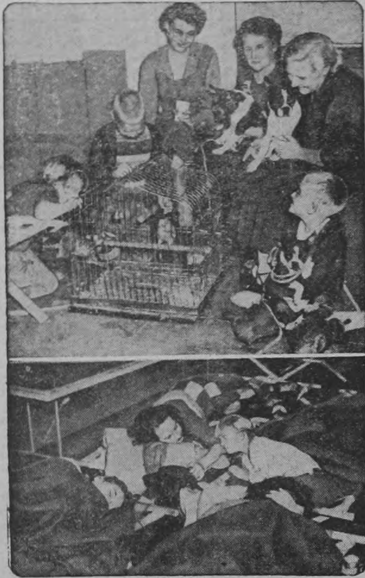
Cuadros como éste se vieron a cada paso en California. Familias enteras evacuaron su hogar ante el peligro de las inundaciones. En la gráfica de arriba se nota a una familia recogiendo sus pertenencias. Abajo, otra de las familias que se vieron obligadas a abandonar su hogar se preparan a dormir en el aula de una escuela que se abrió para dar albergue a las gentes que quedaron sin hogar.